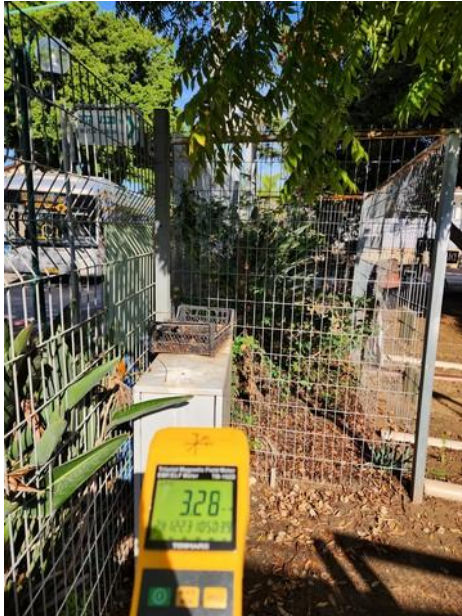
ערך מתקבל בחצר דרומית