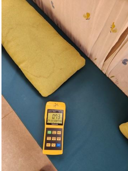
ערך מתקבל בחדר מרכזי