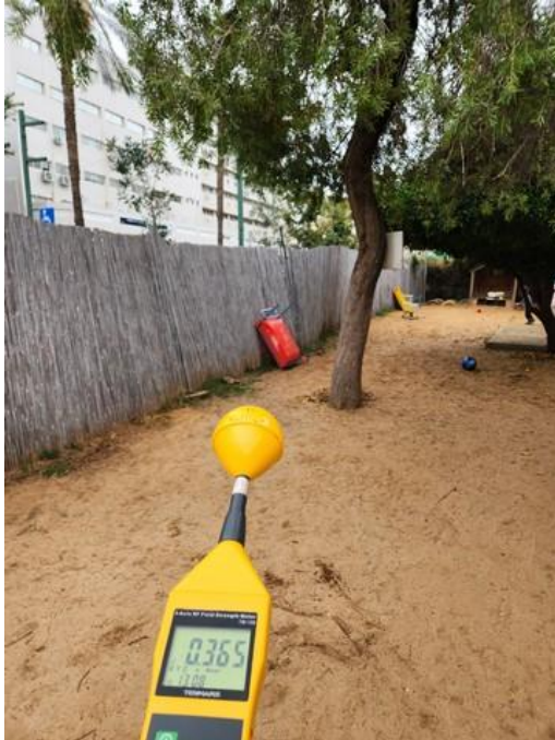
ערך מקסימלי המתקבל בחצר RF