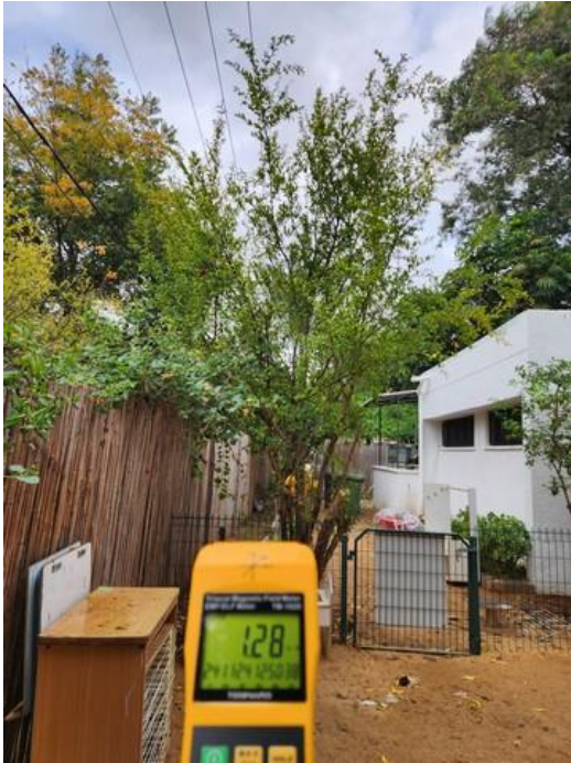
ערך מקסימלי המתקבל בחצר