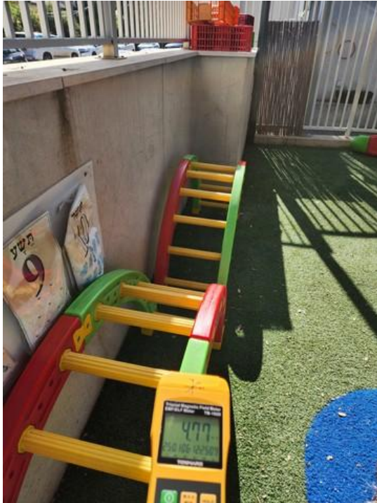
ערך מתקבל בחצר הגן