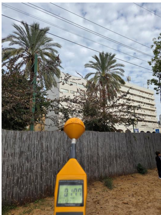
ערך מקסימלי המתקבל בחצר RF