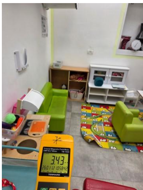
ערך מתקבל בממ"מ