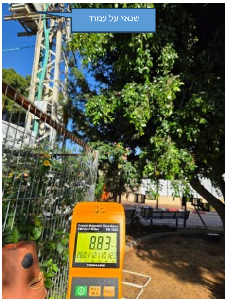
ערך מתקבל בחצר חזית רח' גולומב