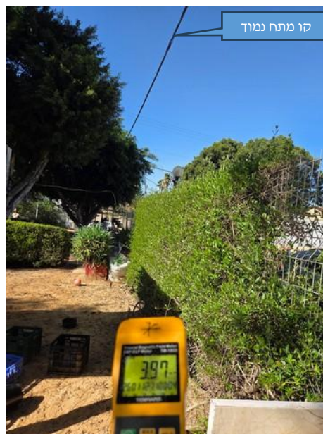
ערך מתקבל בחצר ראשית חזית רח' מבצע קדש