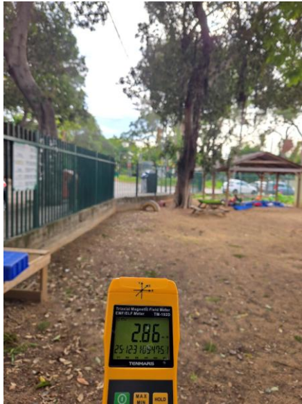
ערך מתקבל בחצר, חזית רחוב גלעד